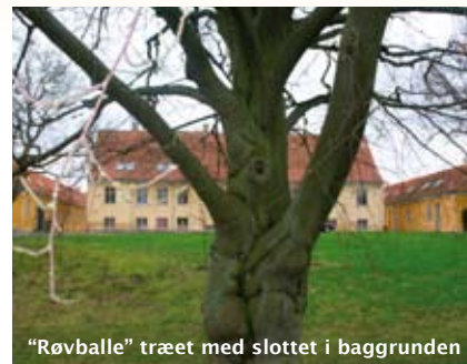
"Røvballe" træet med slottet i baggrunden